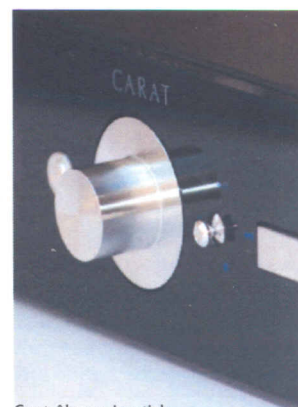
Contrôle par Joystick