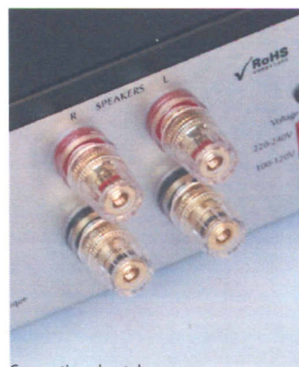
Connectique haut de gamme